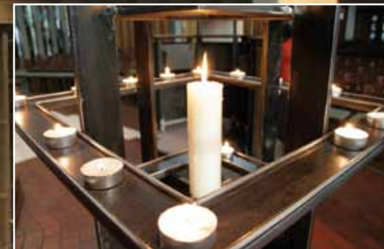
Erleuchtender Moment: Zünden Sie für ein Gebet eine Kerze an und tragen Sie sich bei Bedarf im Fürbittenbuch ein.

Seit Palmsonntag 2010 öffnet die Evangelische Thomas-Kirchengemeinde die Pforten der Christuskirche auch außerhalb der Gottesdienstzeiten. Die Christuskirche ist damit die erste offene evangelische Kirche in Bad Godesberg. Wenn Sie unter der Woche den Wunsch nach einer kleinen Auszeit haben, Ruhe und Besinnung suchen, beten mögen oder sich einfach nur die Kirche ansehen möchten, kommen Sie dienstags bis samstags in der Zeit von 10:00 bis 16:00 Uhr vorbei. Mit einem Team von Ehrenamtlichen möchten wir vor allem im Sommerhalbjahr die Kirche auch länger, bis in die Abendstunden offen halten. Zünden Sie eine Kerze an oder schreiben Sie sich im Fürbittenbuch ein Gebet von der Seele. Ihre Bitten werden wir im Gottesdienst still oder öffentlich für Sie vor Gott bringen. Bei uns finden Sie Informationen über unsere Gemeinde, die Christuskirche sowie das ganze bunte „evangelische“ Leben in Bad Godesberg. Bücher und Texte möchten Sie anregen zu Gebet und Meditation. Oder Sie kommen Sonntags vorbei! Um 10.30 Uhr feiern wir Gottesdienst - nach lutherischer Tradition für Menschen von heute. Anschließend gibt es Kaffee, Begegnung und Gespräche oder Sie besuchen unsere hervorragend sortierte Bücherei.